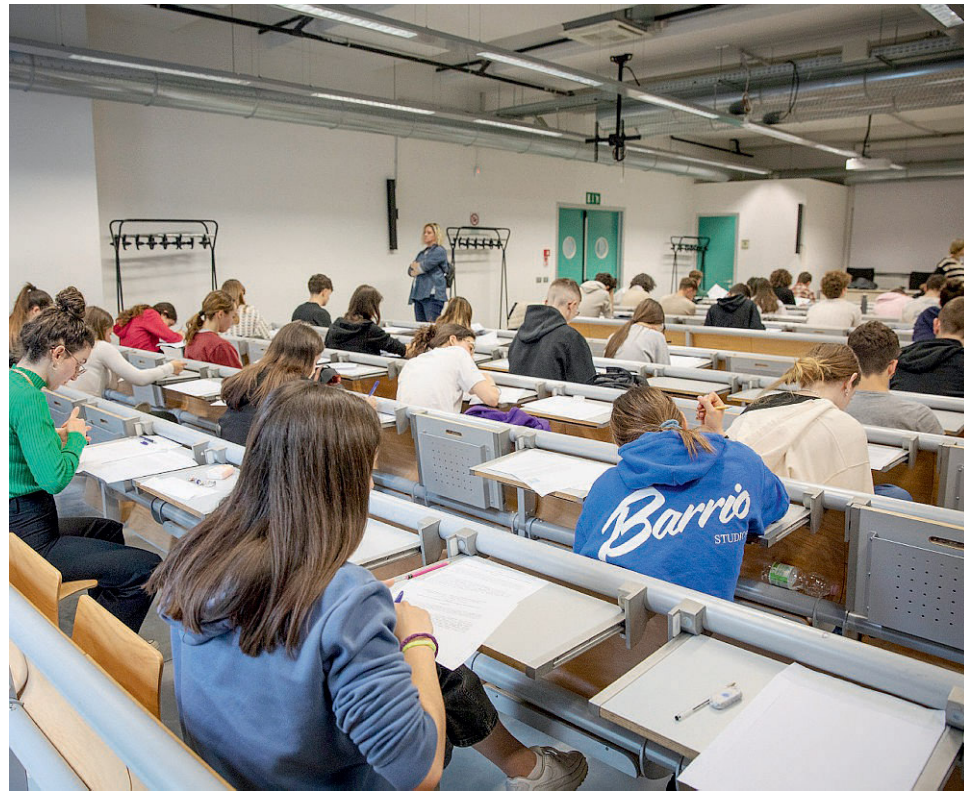
Università di Parma Un esame di latino per gli studenti del nostro Ateneo.

B en venga il progetto «Corda», cooperazione per l'orientamento e la riduzione delle difficoltà di accesso, organizzato dall'Università di Parma. In questo caso per il latino: un aiuto per passare più facilmente dalla scuola all'Università. «Sei uno studente del quarto o del quinto anno della scuola secondaria di secondo grado? - è scritto nella locandina -. Stai studiando il latino e ti piacerebbe iscriverti ad un corso di laurea in materie umanistiche? Magari all'Università di Parma? Oppure vuoi approfondire le tue conoscenze e rafforzare le tue competenze? Allora i corsi Corda di latino fanno per te». I corsi Corda di latino possono valere come ore di orientamento universitario e, se conclusi con buoni o ottimi risultati, danno diritto ad un bonus per gli esami di Lingua e Letteratura latina all'Università di Parma. Ed ecco le caratteristiche dei corsi di 40 ore con due livelli: avanzato (nella sede del liceo Romagnosi) e laboratorio di commento; intermedio (nella sede del liceo Marconi) e laboratorio di traduzione. I corsi avranno un numero minimo di 8 studenti, massimo 25 per corso. Il requisito? La buona conoscenza della grammatica normativa della lingua latina. Il programma avanzato condotto dalle professoresse Lorenza Reverberi e An-